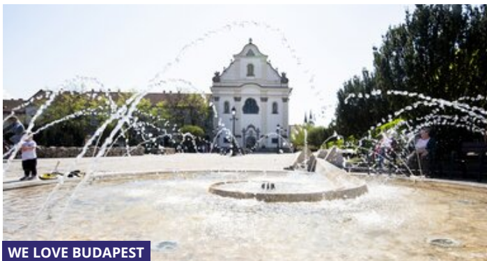
WE LOVE BUDAPEST

LÉLEGZETÁLLÍTÓ PILLANATOK: EZEK LETTEK 2022 LEGSZEBB KUTYÁS FOTÓI